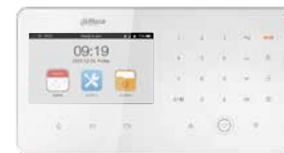
ARC5402A-GW Видеопанель управления