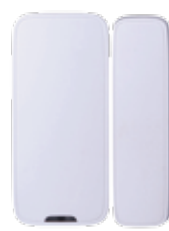
ARD311-W Магнитный датчик двери/окна