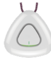
ARD800-W Тревожная кнопка